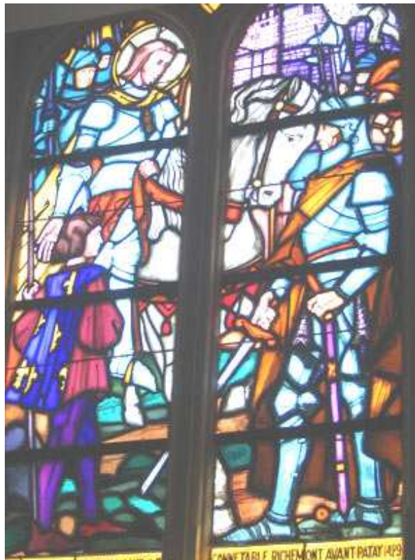
Vitrail, Le Connétable face à Jeanne d'Arc, Eglise Saint-Saturnin, Sarzeau

En effet, dès 1427, Richemont est chassé de la cour de France. Rebelle et indiscipliné, il conduit une rébellion contre le roi Charles VII en février 1429 avant de se faire pardonner par le souverain et menait pour lui, la même année, aux côtés de Jeanne d'Arc, la bataille victorieuse de Patay (Loiret), en juin. C'est cet épisode qui est représenté sur le vitrail situé dans le narthex de l'église paroissiale Saint Saturnin de Sarzeau.