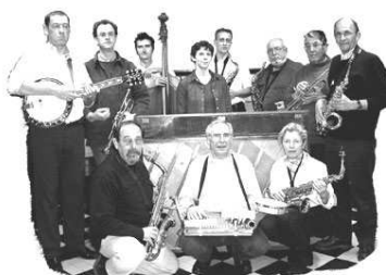
Jazz en Rhuy

Le cadre intime du bourg fait d'Arzon une place de fête conviviale. Cette manifestation intercommunale n'a qu'un seul mot d'ordre : Faites de la musique !