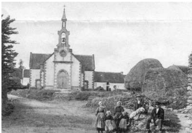
L'église de Penvins au temps d'Adrien Régent.

Adrien Régent remarquait déjà vers 1900 que « Penvins, grand village, où l'on trouve encore beaucoup de